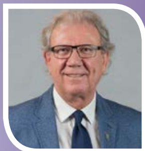
JACQUES GARIÉPY Maire de Saint-Sauveur