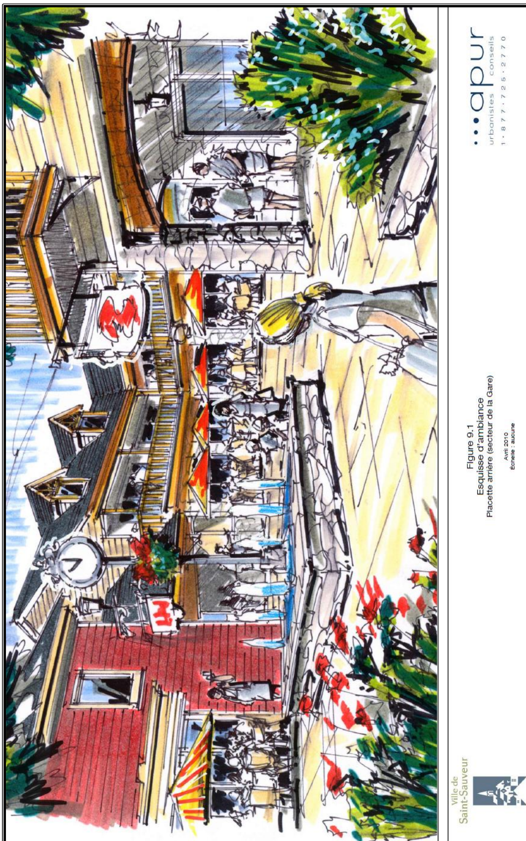
Figure 9.1 Esquisse d'ambiance Placette arrière (secteur de la Gare)