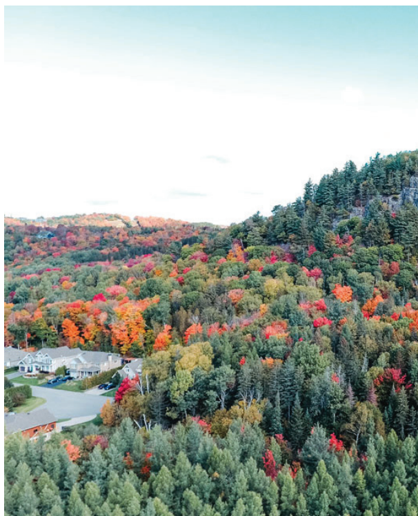
Une étendue de pins blancs, essence emblématique de Saint-Sauveur pour sa résilience.

Pour en savoir plus sur les actions prévues, les essences recommandées et les objectifs de verdissement, numériser le code QR ci-contre ou visitez le vss.ca/politique-de-larbre .